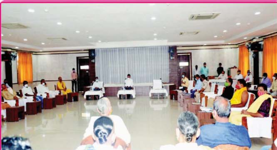
ତା. ୨୪.୧୧.୨୦ରେ ନୀଳାଦ୍ରି ଭକ୍ତ ନିବାସ ଠାରେ ଶ୍ରୀମନ୍ଦିର ମୁଖ୍ୟ ପ୍ରଶାସକ ଡଃ. କ୍ରିଷନ୍ କୁମାରଙ୍କ ଅଧକ୍ଷତାରେ ଆହୂତ 'ଛତିଶା ନିଯୋଗ' ବୈଠକ ।