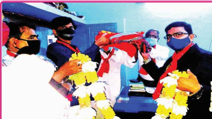
ତା. ୨୨.୧୧.୨୦ରେ ଶ୍ରୀମନ୍ଦିର ପ୍ରଶାସନ ତରଫରୁ କେନ୍ଦ୍ରାପଡ଼ାସ୍ଥିତ ଶ୍ରୀବଳଦେବଜୀଉଙ୍କ ପ୍ରଳୟାସୁର ବଧ ବେଶ ପରିପ୍ରେକ୍ଷାରେ 'ନୂତନ ପାଟ ଶାଢ଼ୀ' ମନ୍ଦିର ପୂଜକଙ୍କୁ ପ୍ରଦାନ କରାଯାଉଛି ।