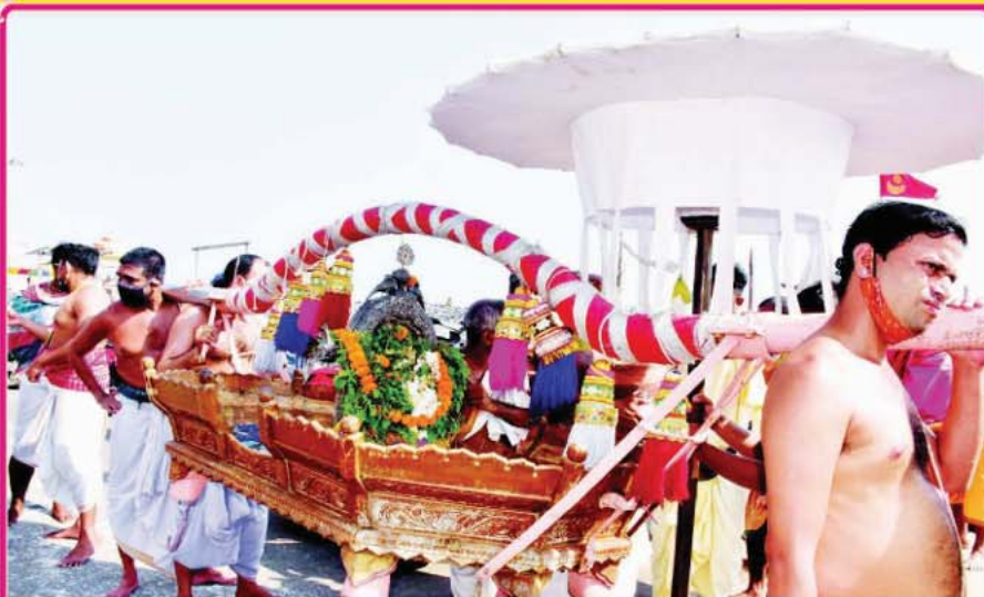
ତା. ୧୫.୧୧.୨୦ରେ ଦାପାବଳୀ ଅମାବାସ୍ୟା ଅବସରରେ ଶ୍ରୀନାରାୟଣ ଦେବଙ୍କ ସାଗର ବିଜେ ।